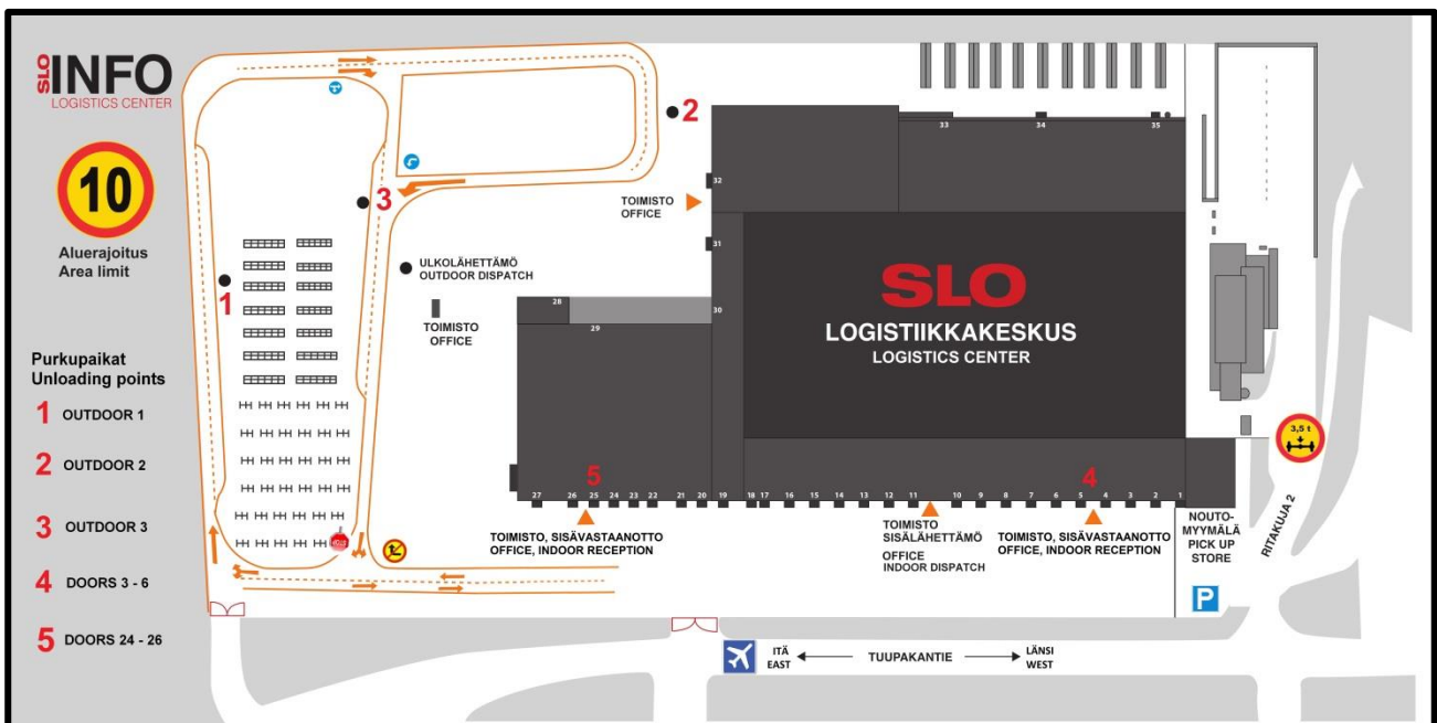
Kuva 1: Logistiikkakeskuksen purkualueet