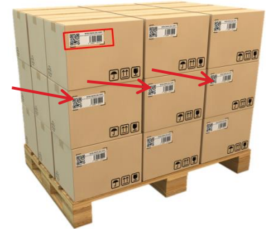
Kuva 3: Lähetystarra kuljetusyksikön pinnassa