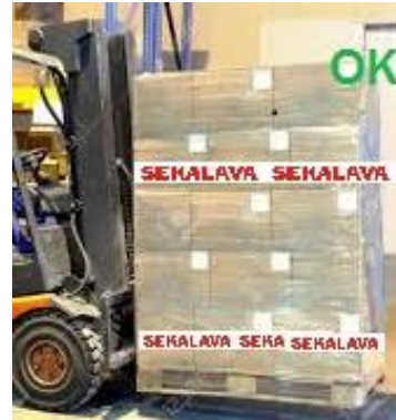
Kuva 7: Sekalavan huomioteippaus