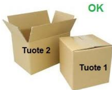
Kuva 4: Eri tuotteet erillisiin pakkauksiin

3.2.6. Standardista poikkeavat kelat (ylipitkät ja vajaat) on merkittävä selkeästi esim. laippaan kiinnitettävällä värillisellä tarralla tai kelan ympärille kiedottavalla värillisellä teipillä/narulla.