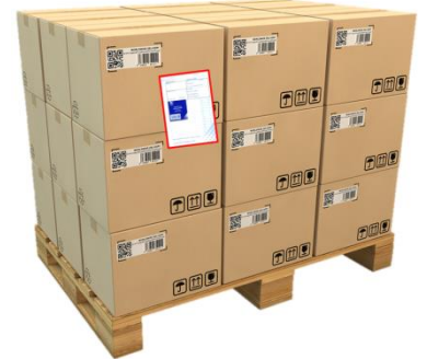
Kuva 2: Lähete kuljetusyksikön pinnassa

3.1.3. Lähetystarrassa (kuva 3) on oltava seuraavat asiat